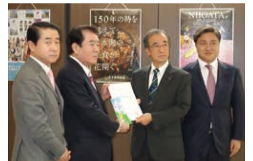
1月25日(金)、花角知事に平成31年度 県予算編成に係る要望を行いました。