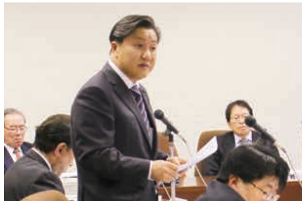
洋上風力発電などについて議論した産業経済委員会 = 2月28日、県議会