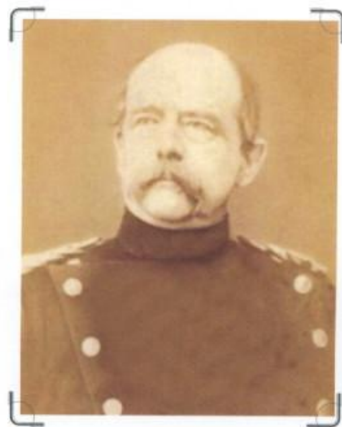
El Canciller Otto Von Bismarck

A su vez, la Ley N° 4.055, del 8 de diciembre de 1924, se dictó “para proteger las contingencias de enfermedad, invalidez, vejez y