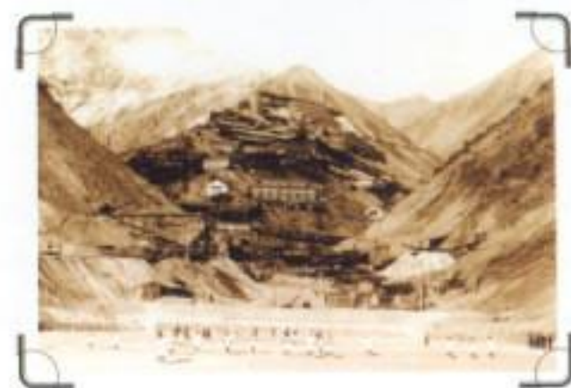
Mina El Teniente 1936.