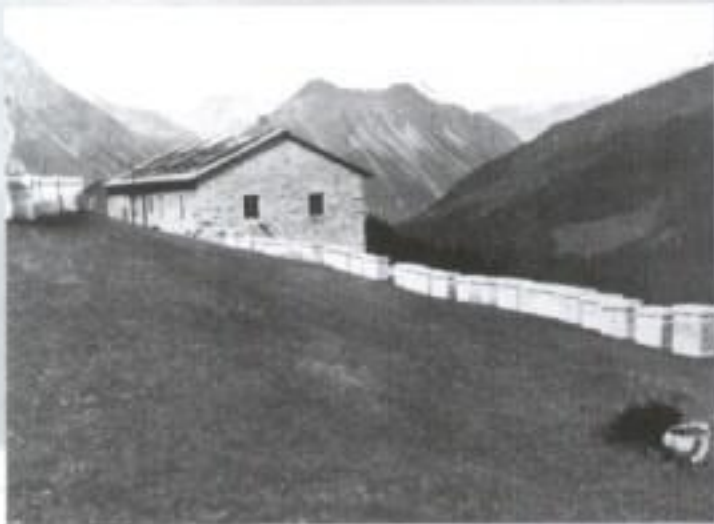
Un colmenar Ambrosoli en los Alpes Italianos a 2.500 metros de altura, verano de 1932.

"Son los pequeños detalles los que hacen una gran empresa".