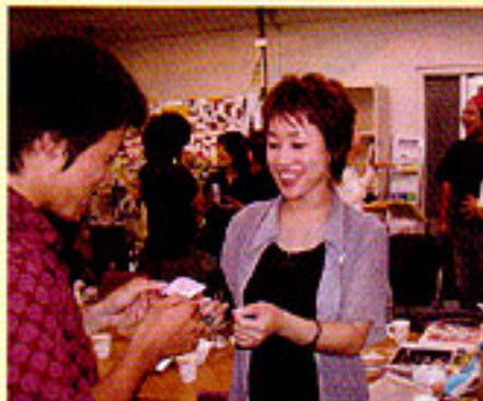
「SOHOプロデューションを通じて、初めてSOHOへ仕事を依頼された企業から「無理難題でいい仕事をしてくれ。今後もお願いしたい」と評価の言葉を頂いた事は、本当にうれしかったです」と卒業社員はサイト運営の成果を語る。

1人のためにも、SOHO一人ひとりと実際に会い、能力や人柄を把握することが重要になってくる。同社の事業は、SOHOとの信頼関係のもとにあるといえる。 SOHOが持つプロの技術とサイトを通じて発信