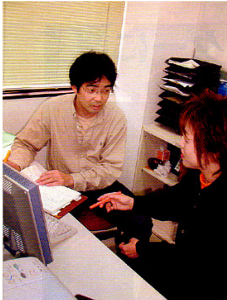
パソコン講師やデザイナー、販売プランナーなど、幅広い種類のSOHOをタイアップしている。企業とSOHOをつなぐ橋渡し役として、受注した仕事の打ち合わせや経過確認も入念に行っている。