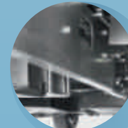
Lågbyggt bredspårigt chassi från AL-KO