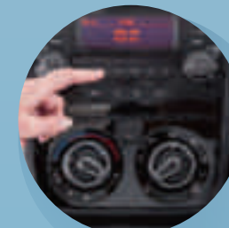
Designad instrumentpanel med helt integrerad fabriksmonterad Stereo/MP3 spelare med Bluetooth, timer som med justering upp till 3 timmar och antenn i backspegeln för bättre mottagning