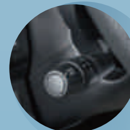
Luftkonditionering bildel och farthållare