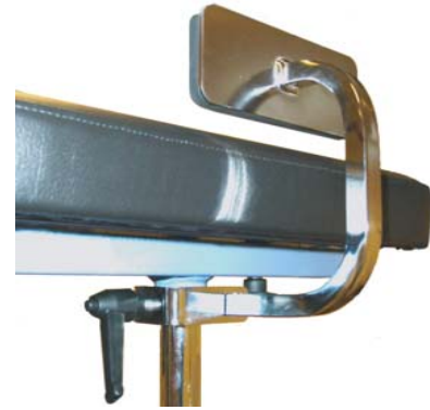
Sidostöd kpl par Art. nr. 300015710