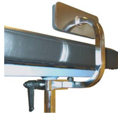
Sidostöd kpl par Art. nr. 300015710