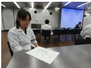
↓医局の方針について真剣に聞く教室員達