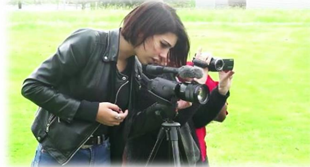
Initiation au métier de journaliste et techniques vidéos, investigations, rédactionnel, applications smartphone, etc...