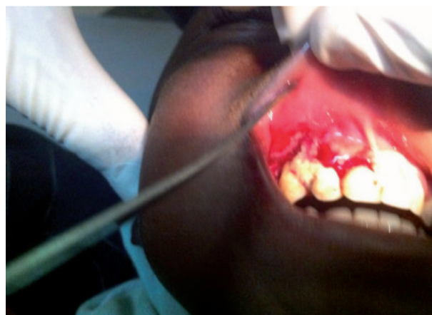
> Fig. 4: secondo caso, lesione primaria ulcera e necrosi ossea