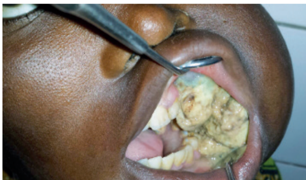
> Fig. 7 e 8: caso parossistico