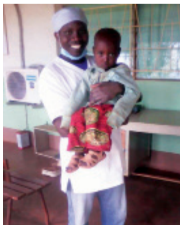
> Fig. 6: secondo caso al termine della terapia