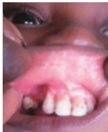
> Fig. 5: secondo caso dopo l'intervento