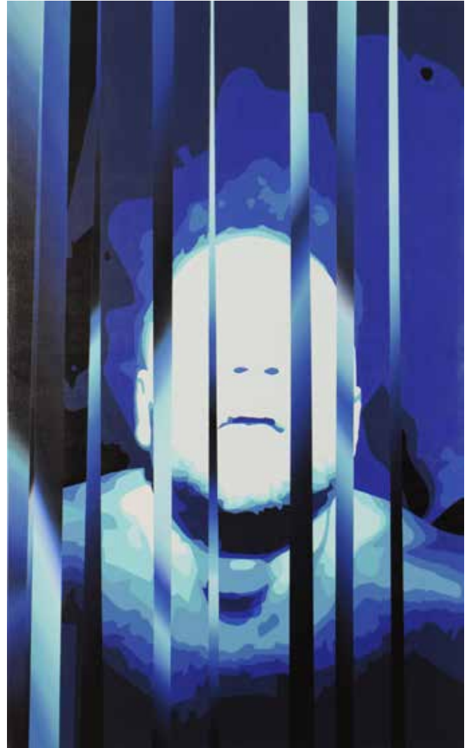
Husmeando en la luz - 2016 - Acrílico s/tela - 180 x 110 cm.