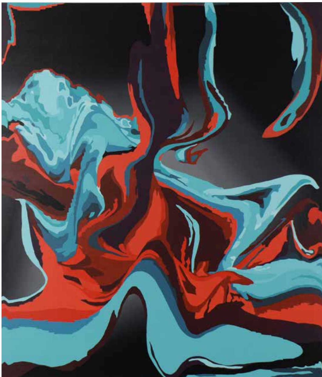
Sin título - 2017 - Acrílico s/tela - 150 x 130 cm.