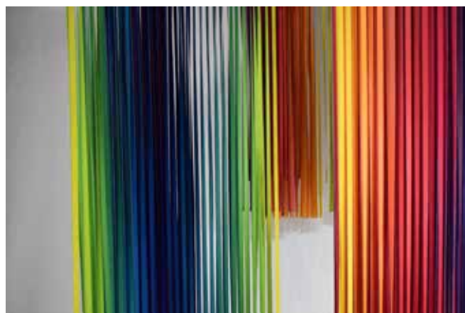
► Spectrum - 2019 - Tela de algodón intervenida con acrílico, seccionada en tiras suspendidas de parrillas de mdf - Medidas variables (Arriba, detalles)