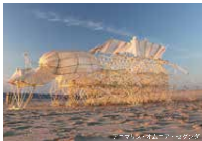
アニメリス・オムニア・セガンダ