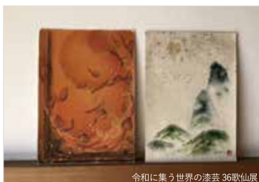
令和に集う世界の漆芸 36歌仙展