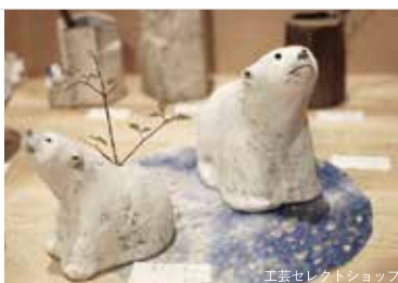
工芸セレクトショップ