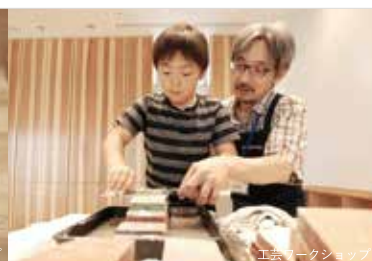
工芸ワークショップ