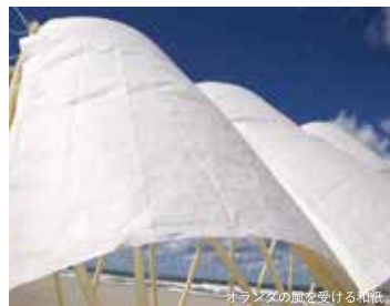
オランダの風を受ける和紙