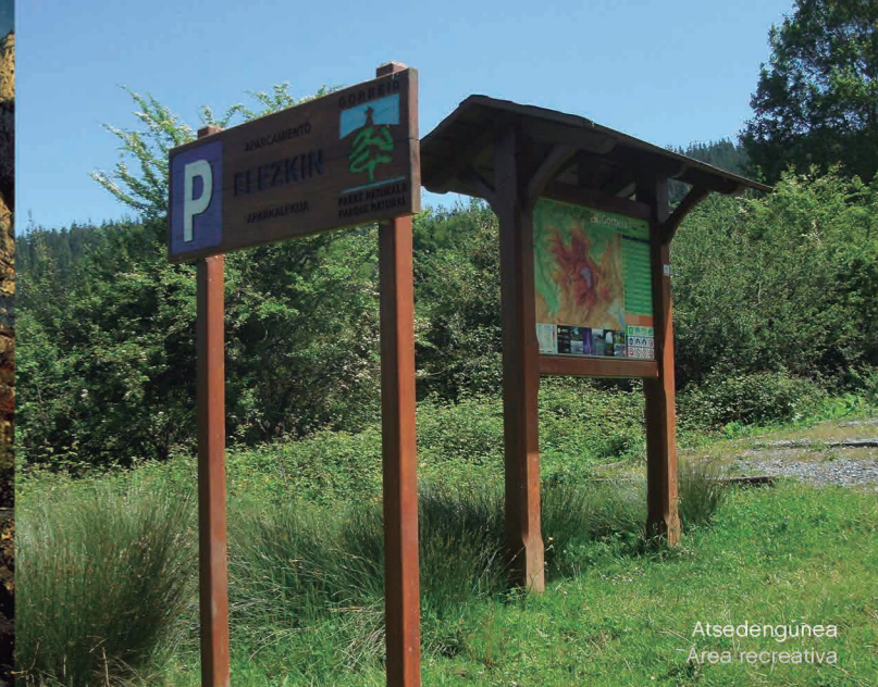
Atsedengunea Área recreativa