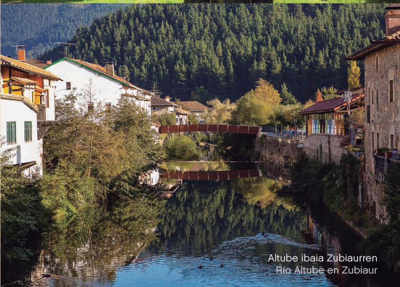
Altube ibaia Zubiaurren Río Altube en Zubiaur