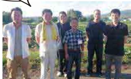
なよろとうもろこし生産者の方々