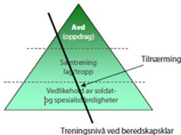
Figur: Tilnærming til beredskapsklar