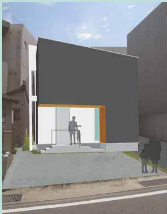
planned by ナカノジロウ建築デザイン事務所

「LHSの家」は、ひょうたん島不動産が提案する建築家の家づくりをギュッと凝縮したお家。コンパクトながらも随所に暮らし方をサポートするアイデア満載の新築住宅です。数々の難題を解決した建築家の設計力で、この場所ならではの敷地条件を読み解いたプラン。まちなか生活を検討されている方はお問い合わせください。