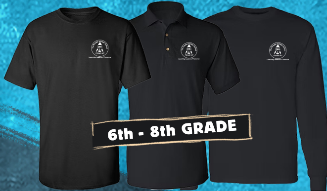
6th - 8th GRADE

Recibe $5 DE DESCUENTO al confirmar tu reserva y gastar $50+!