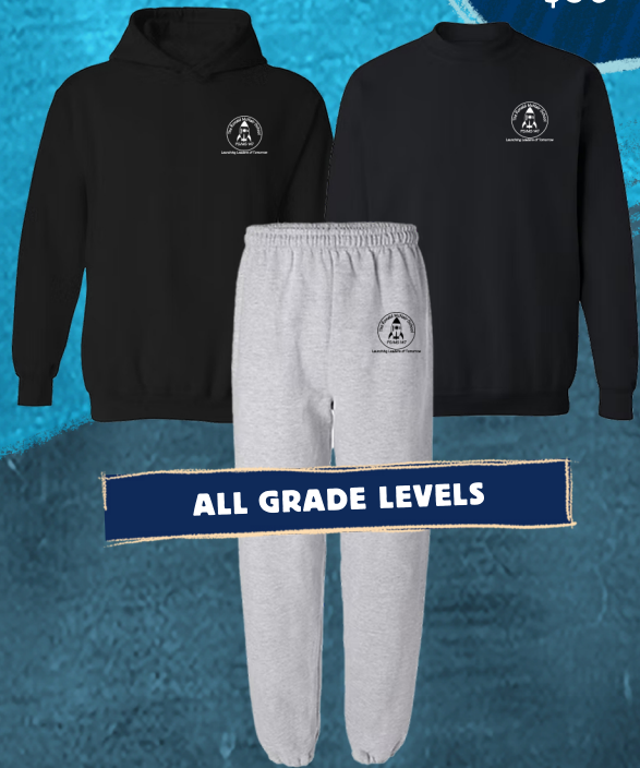
ALL GRADE LEVELS